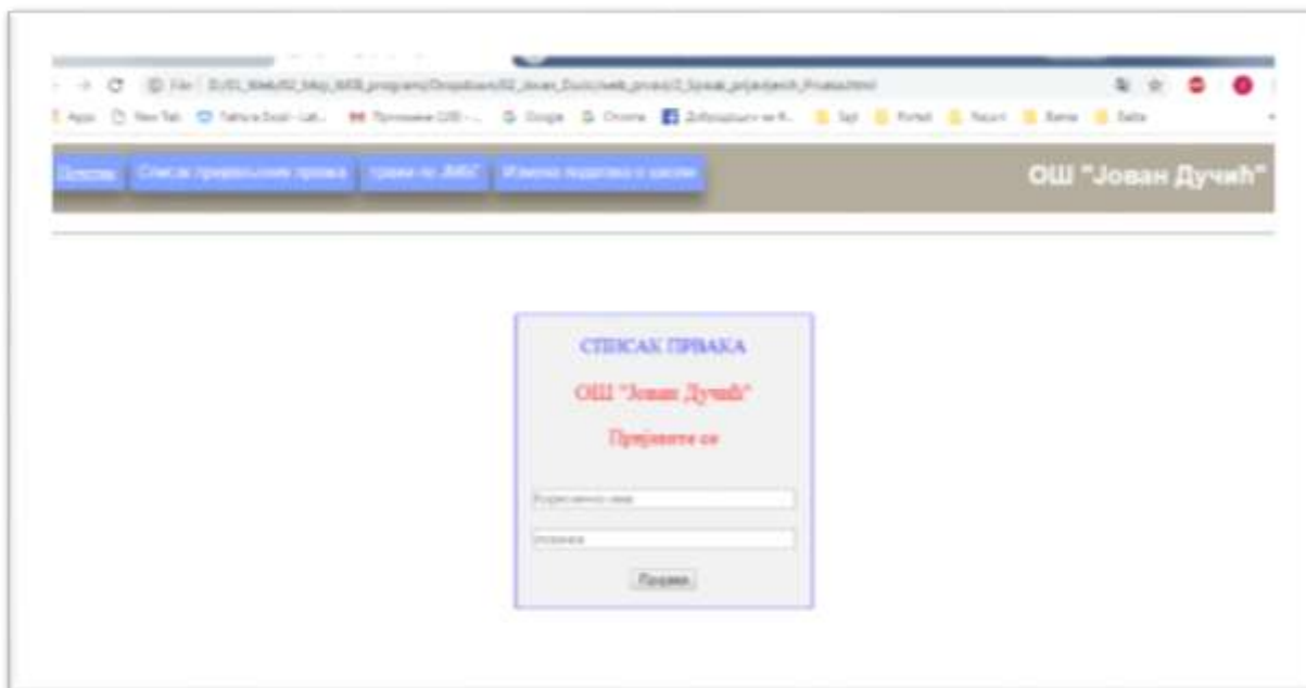
Форма за приказ списка пријављених првака

На следећој слици види се изглед наведене апликације, али без списка ученика.